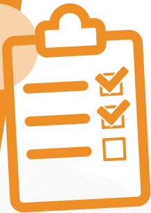
Tabla de Preuso (check list)

Cada vez que se inicia la operación de un equipo, o se realiza un cambio de operador, se debe llenar una Tabla de Preuso. Con esto, la revisión queda registrada y almacenada en Global™ Sky para dar garantía de que el equipo se encuentra 100% operativo. El operador, a través de la pantalla táctil, completa la Tabla de Preuso de forma fácil e intuitiva.